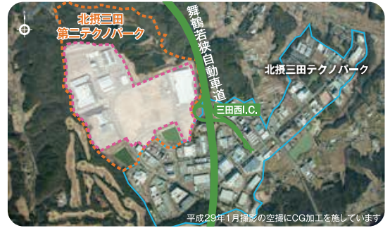
平成29年1月撮影の空撮にCG加工を施しています