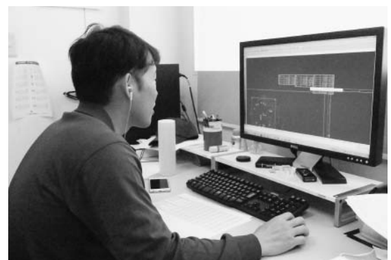
CAD/CAMの導入にもいち早く取り組んできた

15年3月には国際認証も取得し、航空機部品の仕事がさらに広がります。その後、15年度にスタートした活