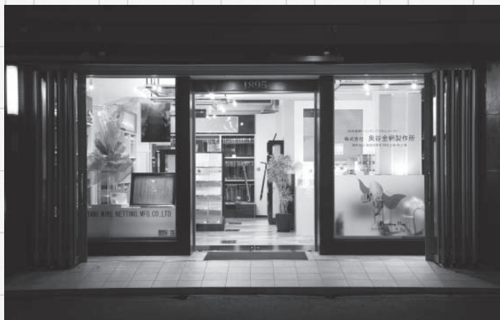
本社ショールーム

さらに、パンチングメタルで世界に打って出ようと、13年にはアメリカのシカゴ、14年にはドイツのデュッセルドルフに相次いで営業所を設けました。既に米国のパンチングメタルメーカーと提携し、実績も上がりつつあります。創業120年を迎え、「これからも常に変化、進化をし続けたい」と力強く語ります。