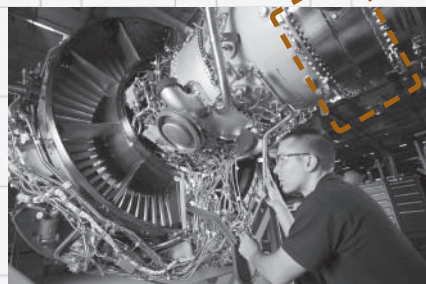
V2500で同社製品が使用されている部分

A350、三菱のMRJをはじめ各社の最新鋭機に組み込まれるエンジン部品の製造に注力しています。ひょうご産業活性化センターの実用化開発資金貸付を活用して複合加工機や検査機を導入し、生産をより効率的に進めるための新たな加工方法の開発も進めているところです。