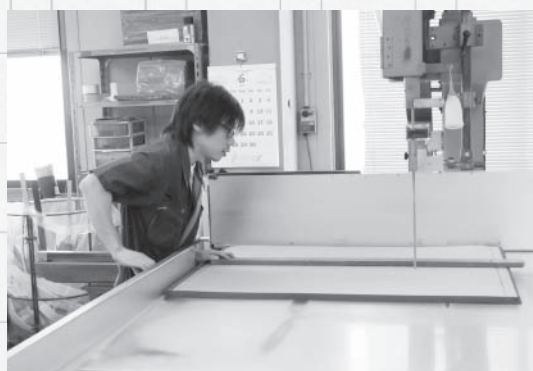
切断機を使ってスポンジをカット