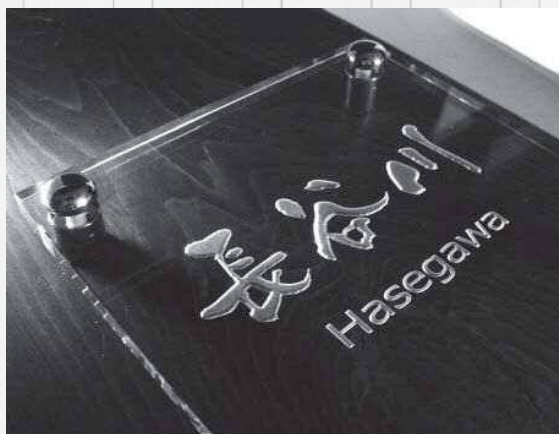
高透過ガラスを使用し、くっきり白い文字が浮かび上がる「CR-GLASSPLATE」

今後については「県内の金属加工業者、木材加工業者などと連携を模索し、ガラスと組み合わせ、新たな外構材の可能性を切り開いていきたい」と話しています。