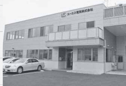
4月に本社・工場を新築移転

ーザーからの細かい指示がないため、これまで同社が培った経験を基に、工場ごとに異なる生産事情を考慮し、製品設計に当たるそうです。スムーズな生産には、動力の安定的供給が不可欠。技術者たちは、実際に動力盤・制御盤を使う企業の視点に立った設計・製作を常に心掛けています。