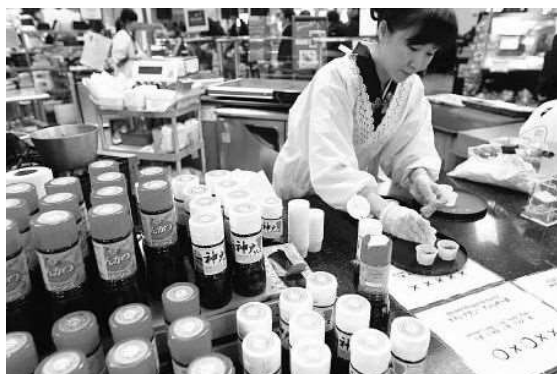
店頭での試食販売

これからも兵庫県の中小企業のアメリカ市場での販路開拓を進めるべく、各社商品の特性に合ったマーケティング手法を考えながら支援していきます。