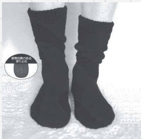
冬場でも足に冷たさを感じない「ぽかぽかルームソックス」

値段は決して手ごろとは言えませんが、高くても良いものという顧客に対し、今後、いかに同社の商品を知ってもらうかが課題だそうです。