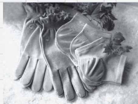
指先やかかとに椿油を含んだシートを付けた「椿油 絹 保湿手袋」と「椿油 絹 かかと保温カバー」