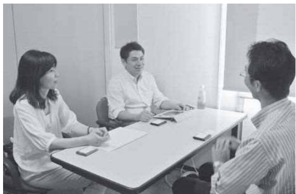
発表後には、一斉商談会も開かれました

エム・ディーヘルシーフーズ（西宮市）は、特許技術の凍結含浸法で作る機能食を企画・開発・販売。近年、農林業分野でシカの食害が深刻化していることを受け、凍結含浸法でシカ肉を調理加工し、おいしくくせのないシカ肉を安価に流通させることを目指しています。