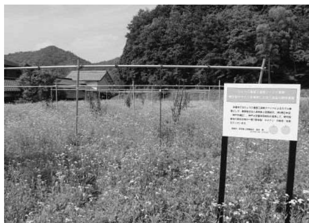
篠山市真南条上営農組合の放棄農地で栽培されるイワテヤマナシ