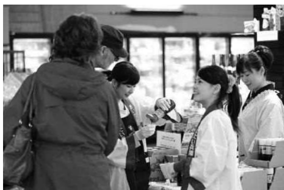
試食する買い物客