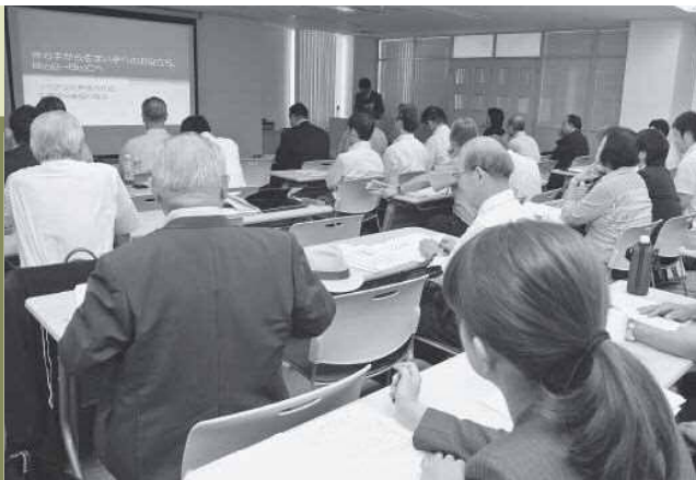
事業計画発表の様子