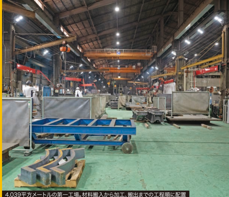
4,039平方メートルの第一工場。材料搬入から加工、搬出までの工程順に配置