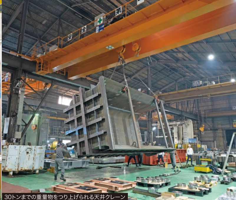
30トンまでの重量物をつり上げられる天井クレーン