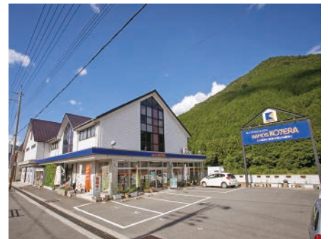
多可町にある本店

競合店がひしめく中、プロユーザーの支持を集める理由は、ビス1本から重機まで約4万点に上る膨大な品ぞろえと、スタッフの豊富な商品知識です。使い方はもちろん、現