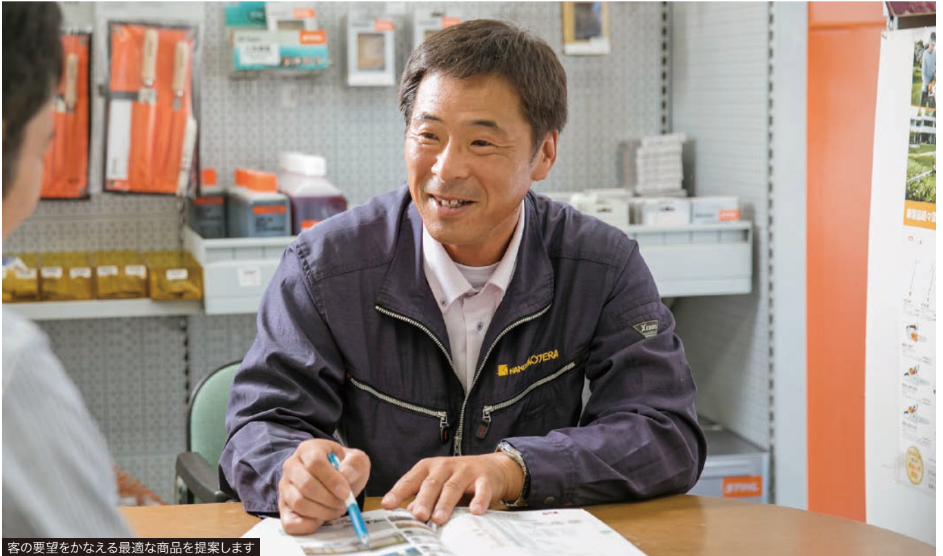
客の要望をかなえる最適な商品を提案します

中小企業支援ネットひょうごでは、さらなる成長が見込める企業を「成長期待企業」に選定し、複合的な支援をしています。このコーナーでは選定企業が誇る自慢の商品やサービスを紹介します。