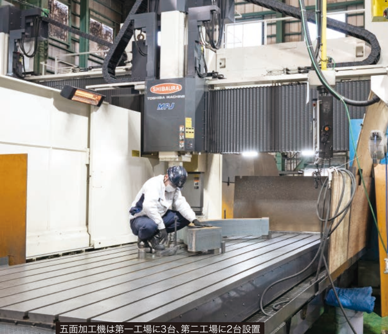
五面加工機は第一工場に3台、第二工場に2台設置