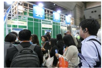
【昨年度のエコプロの様子】