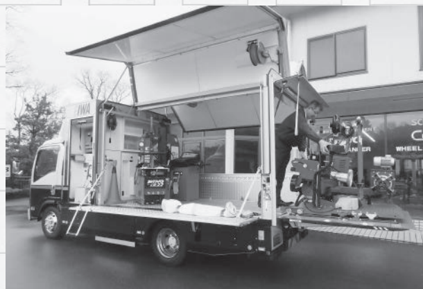
出張サービスカー