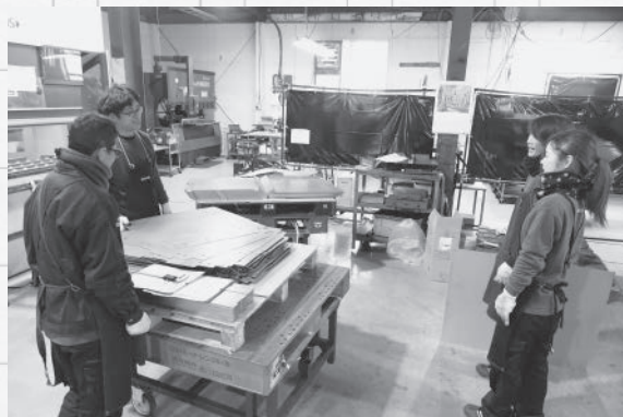
何かあればすぐに話し合いが始まります