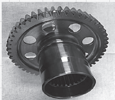
エンジン関連部品

航空機関連産業は今後20年で市場が倍増すると予測される成長市場。今後もエンジン周り部品の受注を増やすべく、着々と準備を進めています。その一つが人材の育成。現在はベトナム人の技能実習生を積極的に採用しており、重工メーカーのOB5人を雇用し、技術を継承する機会を設けています。また、受注できる部品の幅を広げるべく、自社でできない加工、工程を補うためのネットワークづくりも進めていく予定です。今年に入ってからマレーシアまで出向き、外資系エンジンメーカーにも営業に出向きました。いずれは海外での生産拠点開設も視野に入れる大長社長。町工場の夢は大きく広がっています。