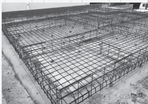
ユニット鉄筋を設置した現場

8年前にベトナム事務所を開設し、設計業務の一部を移管しています。その縁で、日本企業での勤務を希望するベトナム人実習生をあっせんする組合を設立するとともに、来日した実習生に対し日本企業で働く前の1カ月間、言葉や文化などを研修する事業も開始。職人不足に悩む建設業界に対し、人材面からも貢献しようとしています。「人をつなぐことで取引先との関係を強化し、本業のユニット鉄筋の事業強化にもつながれば」。外国人労働者の受け入れを拡大する改正出入国管理法が4月に施行されたことから、今年の研修受け入れは100人を超え、本業を補完するビジネスとしても順調に成長しています。