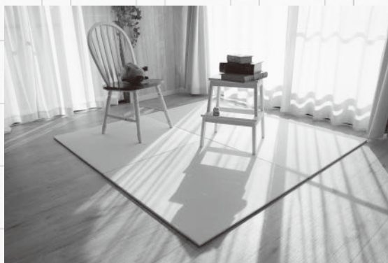
フローリングの上に置くだけで和モダンな部屋に

1年ほど前からは「畳部材を日常に浸透させていきたい」と畳部材を使ったポーチやコースターなど小物の生産も開始。今年は生産工程のIT化を進め、徹底した生産性向上に取り組みます。「まずは数年内に『フロアtatami』の販売を年10万枚まで増やし、国内シェアナンバーワンを獲得した上で海外市場も狙っていききたい」と目標を描いています。