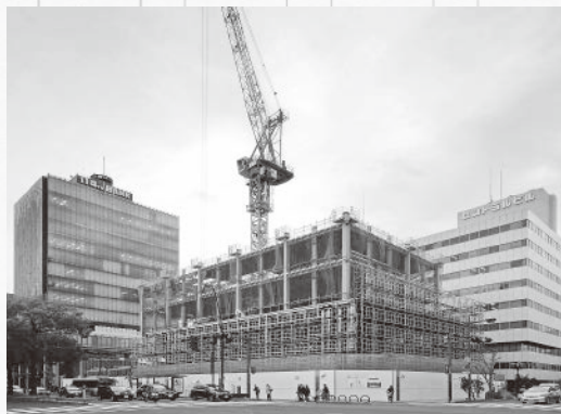
同社の鉄骨を使った建設現場