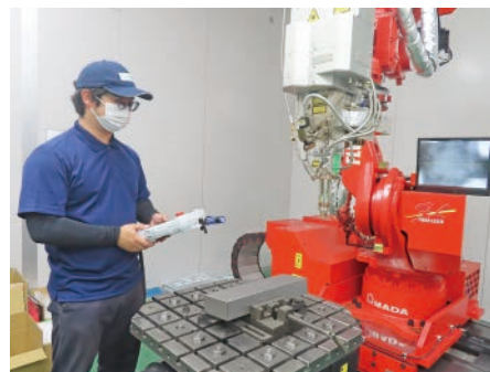
▲真新しい機械を操作する入社1年目の社員

最新鋭の工作機械をそろえるとともに、近年は人材育成にも注力しています。製造現場では外国人社員も含め、全員がJIS溶接技能者の資格を取得しています。また、緻密さ