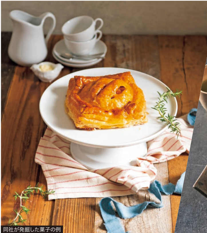
同社が発掘した菓子の例

中小企業支援ネットひょうごでは、さらなる成長が見込める企業を「成長期待企業」に選定し、複合的な支援をしています。このコーナーでは選定企業が誇る自慢の商品やサービスを紹介します。