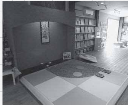
ショールームでは畳を使った新たな和の空間の提案も

問い合わせが近畿以外からも増えてきたことを契機に、名古屋を皮切りに製造・販売拠点を増設。本社工場で技能、営業スキルを習得した社員を向出させています。「当社の考え方を十分に理解した人員を置き、品質の低下や営業方針