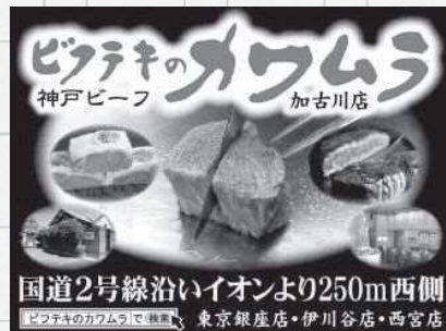
手掛けた屋外広告

主要な取引先はサービス業、その多くが「顧客誘導」看板で集客を目的にしています。そこでまず取り組んだのが分析データに基づいた提案。目的、予算、顧客のターゲットなどから最適な設置場所を調べ、その場所から車で15分圏内の男女別人口、世代別構成比などのデータを調査し分析します。デザイン面においても、文字だけでなく色味から写真の表現の仕方まで、ドライバーや歩行者の