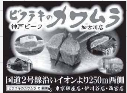
手掛けた屋外広告

主要な取引先はサービス業、その多くが「顧客誘導」看板で集客を目的にしています。そこでまず取り組んだのが分析データに基づいた提案。目的、予算、顧客のターゲットなどから最適な設置場所を調べ、その場所から車で15分圏内の男女別人口、世代別構成比などのデータを調査し分析します。デザイン面においても、文字だけでなく色味から写真の表現の仕方まで、ドライバーや歩行者の