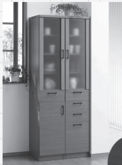
すっきりと隙間なく収まる「すきまくん」

り方も工夫を凝らしました。家具小売店には、顧客の目を引く常設売り場の設定を交渉するとともに、デザイン事務所と契約しパンフレットにも注力。ひと目でどのような出来上がりになるかイメージできるように写真や色を織り交ぜ、「商品タイプ」「幅サイズ」「カラー」「引手カラー」を入力すればそのまま注文番号になるようにしました。