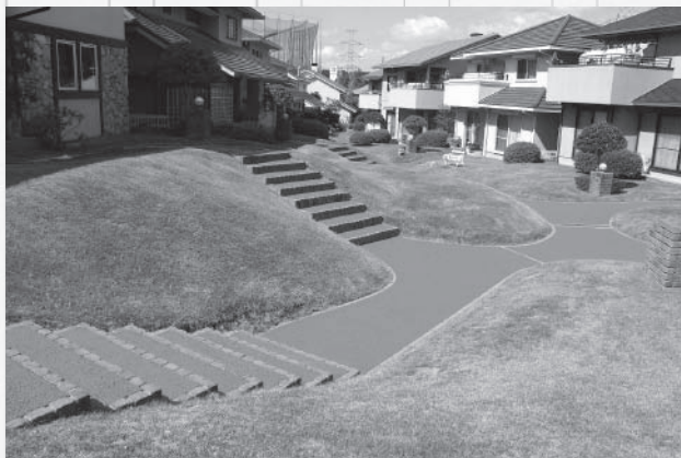
ヒートアイランド現象防止を目的に路盤材として活用。