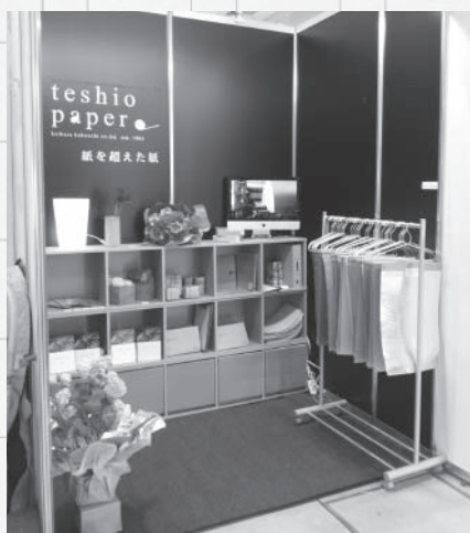
「teshio paper」の売り場も提案しています

るブティックスタイルの販売コーナーも全国の文具店に提案中で、採用店舗も増えつつあります。