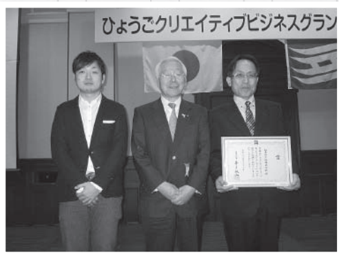
「ひょうごクリエイティブビジネスグランプリ2013」で兵庫県知事賞を受賞

昨年は20数年ぶりに新工場を増設し、今春には新たなエンボス機を導入するなど、teshio paperの増産体制も整います。「3年前にはここまで前向きになるとは想像もできませんでした。5年後にはteshio paperの売り上げを全体の2割まで引き上げたいです」と意気込んでいます。