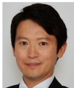
齋藤 元彦 知事