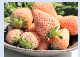
▲淡路島の白いちご『淡雪（あわゆき）』

廃食用油を飲食店などから回収し、飼料原料・ハンドソープ・BDF（バイオディーゼル燃料）などに再利用。また、農業にも取り組んでおり、淡路島の廃校において、BDFを活用したビニールハウスでイチゴを生産・販売。