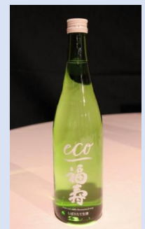
▲世界初カーボンゼロの日本酒『福寿 純米酒 エコゼロ』

日本酒の製造工程において、100%再生可能エネルギーとカーボンニュートラルな都市ガスの利用、ビンの再資源化、酒粕の再利用、資源の保全と節水などに取り組み、令和4年10月には、世界で初めて製造工程におけるカーボンゼロ（二酸化炭素排出量が実質ゼロ）を達成した日本酒を販売。