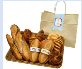
▲売れ残ったパンの詰め合わせ『ツナグパン』

売れ残ったパンを詰め合わせ、定価の約6割で翌日販売するシステム「ツナグパン」を令和3年12月に開始。購入者にはチェーン全店で使える100円相当の「エシカルコイン」を贈呈し、同額のコインを提携支援先の福祉施設にも贈呈して、フードロスの削減と社会的弱者の自立支援に貢献。